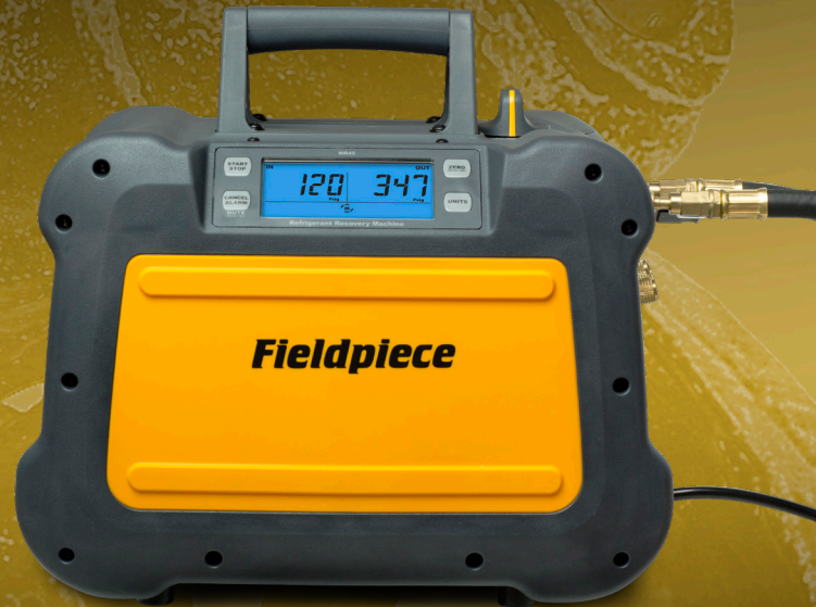
Parlak dijital ekran