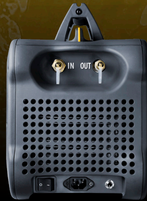
Kolay erişilebilir portlar sayesinde tek elle rahat kullanım