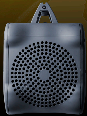
3,000 RPM devir sayesinde hızlı geri toplama